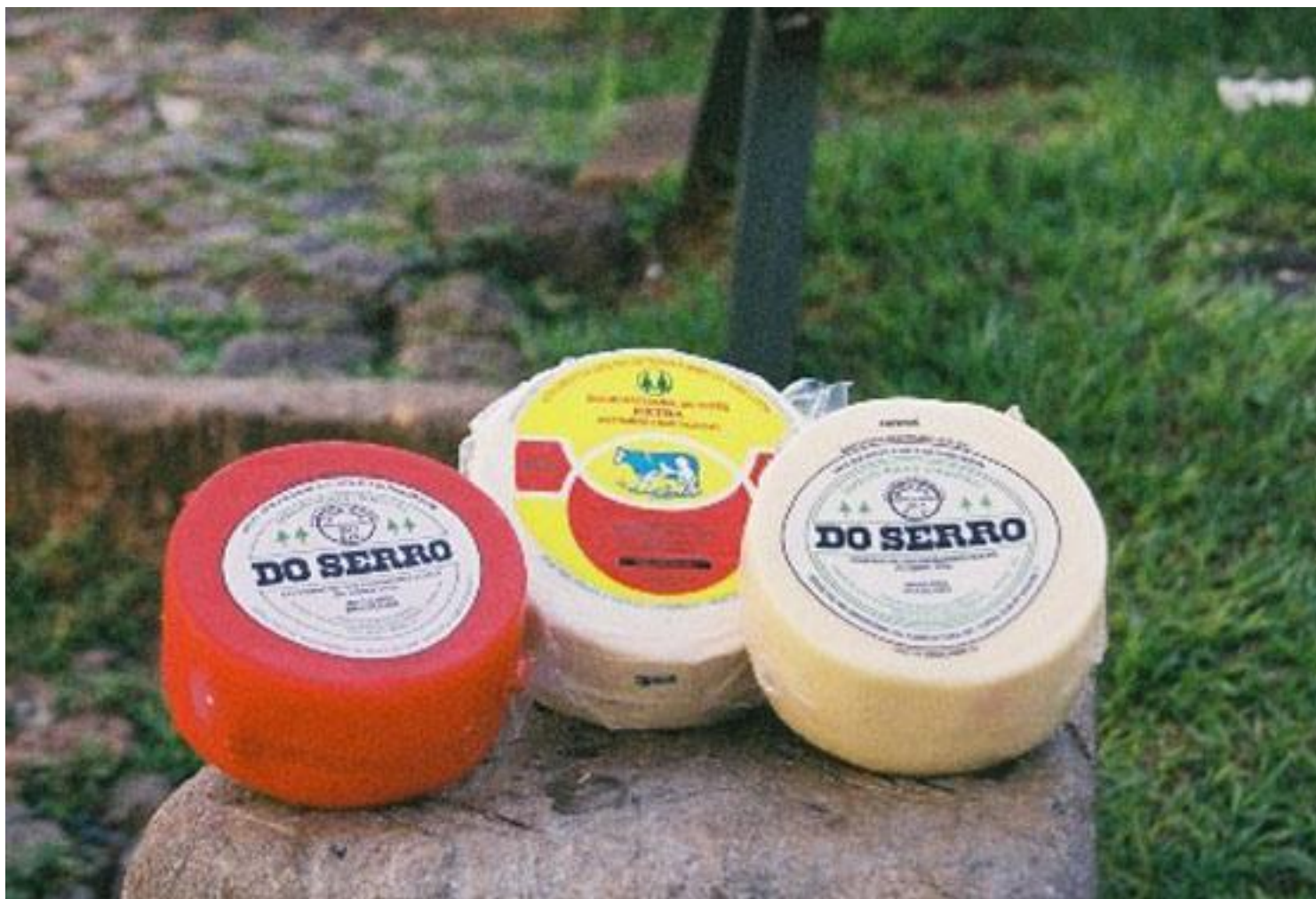
Além do queijo artesanal (centro) as queijarias do Serro produzem o tipo cobocó (esquerda) e o minas padrão (direita), este último com leite pasteurizado.

produz queijos industrializados e que pode ser conhecida desde que as visitas sejam marcadas com antecedência.