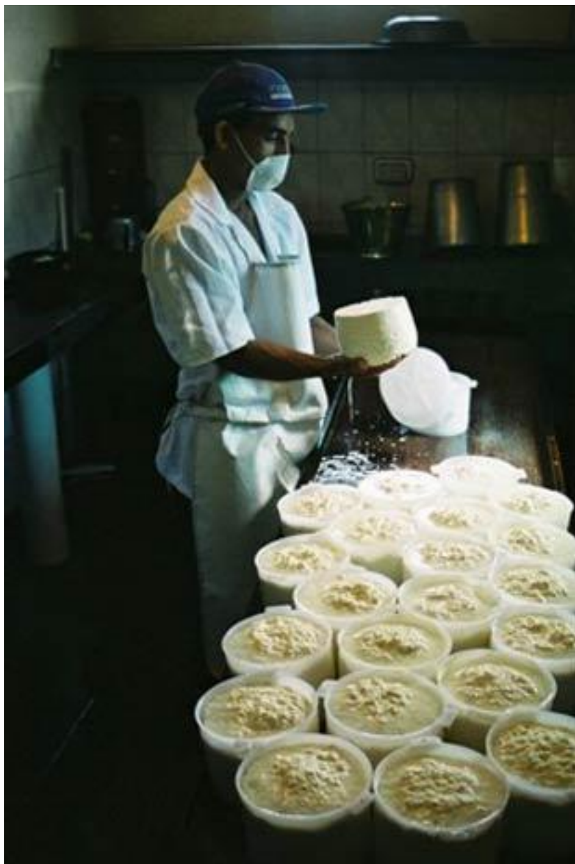
Produção artesanal do queijo do Serro

A antiga Vila do Serro Frio, hoje simplesmente Serro, é uma pequena cidade de pouco mais de 20 mil habitantes, localizada na região do Alto Jequitinhonha (Médio Espinhaço), a cerca de 300 quilômetros de Belo Horizonte e 90 de Diamantina. Cidade histórica, foi ocupada pela Coroa Portuguesa no início do século XVIII, atrás do ouro e do diamante, abundantes na região. Chegou a ser o principal núcleo minerador do centro-norte da Capitania de Minas Gerais. Fazia parte da Estrada Real.