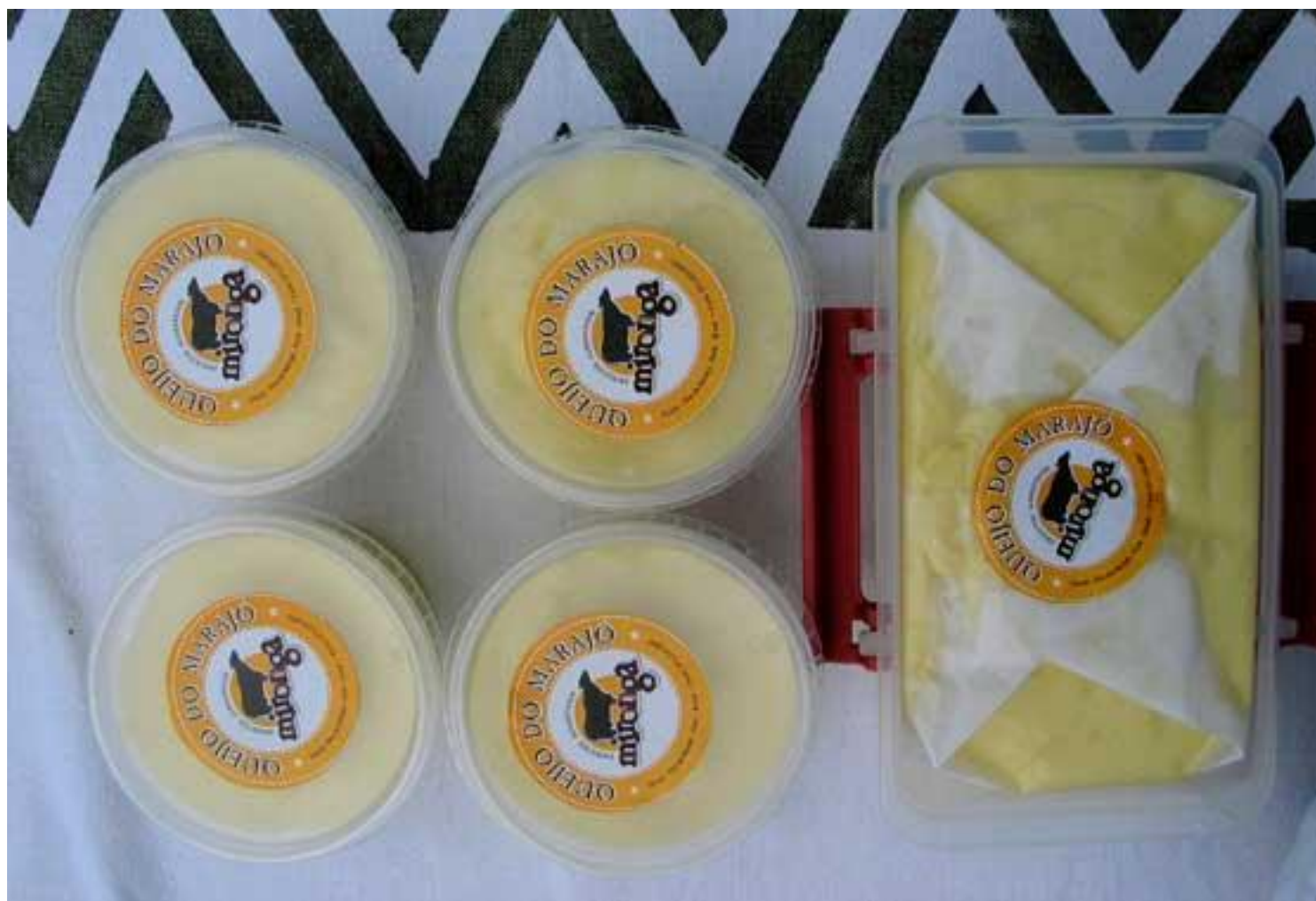
O queijo do Marajó pronto para ser vendido.

A produção não é grande, cerca de 20 queijos por dia, e vendida toda em Soure, no Rei do Frango, perto do Soure Hotel. Mas muitos turistas e moradores compram o queijo na própria fazenda, onde se pode fazer até um pequeno passeio de búfalo.