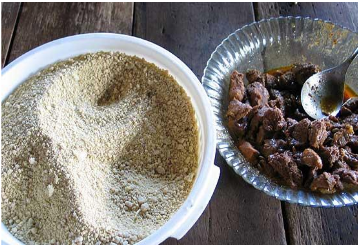
Porção de frito do vaqueiro.