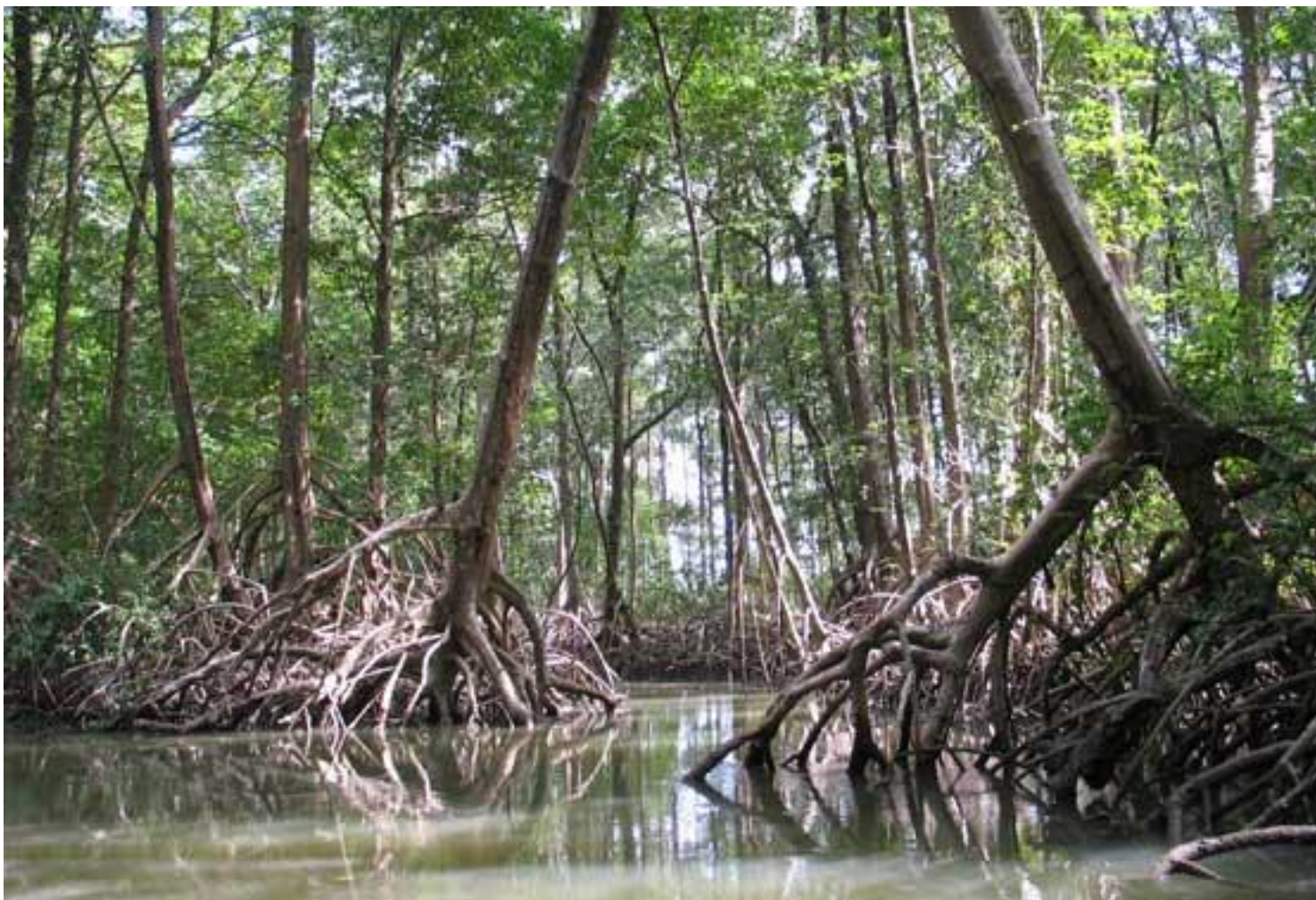
Igarapés na Fazenda São Jerônimo. O local foi palco de uma edição do programa No Limite.