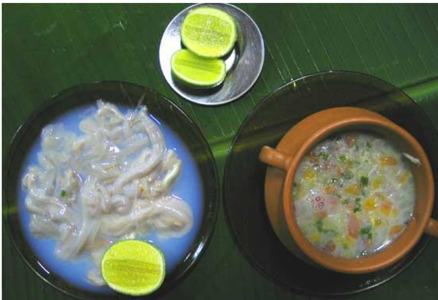
A sopa de turú (à direita). À esquerda, o turú, antes de virar sopa

O turú, com todo o respeito, parece um verme e, por conta disso, sua aparência não é das melhores. Mas é de alto teor nutritivo. Vive dentro do tronco do mangueiro (árvore dos mangues que pode chegar a 30 metros de altura), alimenta-se da seiva da árvore e pode chegar a um metro de comprimento. Para se fazer a sopa, que pode ser provada no Paraíso Verde, em Soure, corta-se o turú em pedaços pequenos e cozinha-se com água e tempero. O resultado é um caldo de sabor forte. Dizem na ilha que é afrodisíaco.